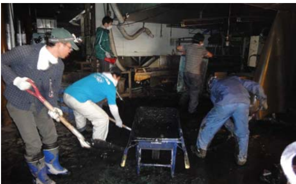
工場内は津波が押し寄せて船の重油がまざったヘドロで埋まった。ヘドロを真っ黒になって掻き出す生協チーム。