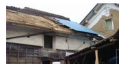
屋根瓦や土壁の多くは崩落