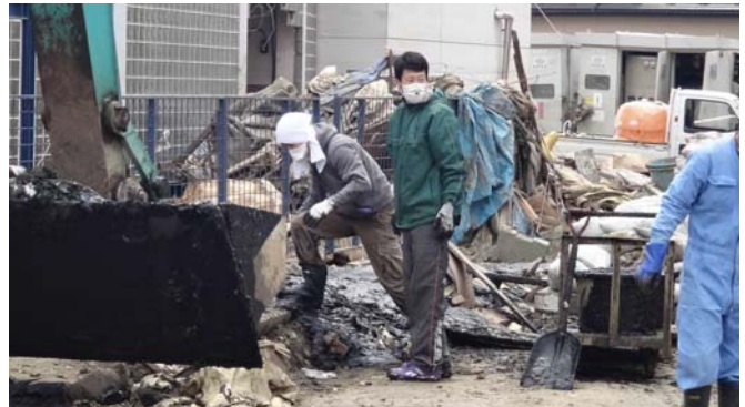
ユンボの前で、ヘドロを排出する生協チーム