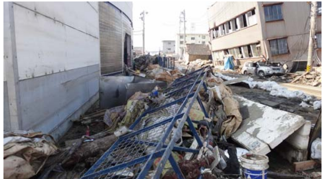
本社工場前の瓦礫の山。前には3階建てが1階部分が潰れて斜めになっている電気会社。