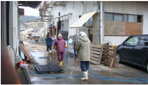
ようやく水道が通り、社員総出で工場内のヘド口除去作業