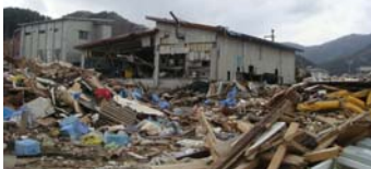
回りは壊滅状況の中、奇跡的に残ったコタニ工場