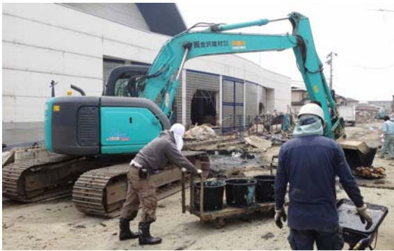
ユンボで瓦礫やヘドロをダンプに。総計30台分の撤去。

ユンボ、ダンプ、発電機、揚水ポンプ、高圧洗浄機を持ち込み 瓦礫撤去・工場内重油ヘドロ除去・機器洗浄作業