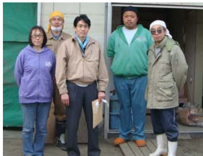
「頑張って再建します」(中央:小谷社長)