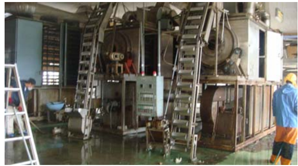
下半分は津波にかぶったわかめの乾燥機