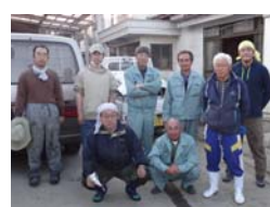
茨城有機農研魚住チーム 金澤建材重機チーム