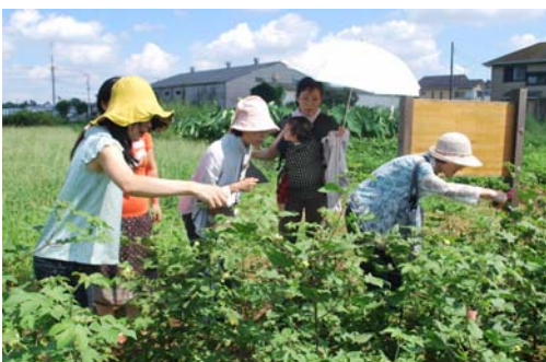
つくば市の ワタ畑にて

9月7日、送り先の「あいコープふくしま」の理事さんたちが、「お布団のふるさどを見たい！」「綿くりに気持ちを込めて下さったみなさんに会いたい！」と訪ねて来られ、綿くり作業をしてくれた組合員さんとごいっしょに綿畑やふとん屋さんを訪ねながら交流しました。