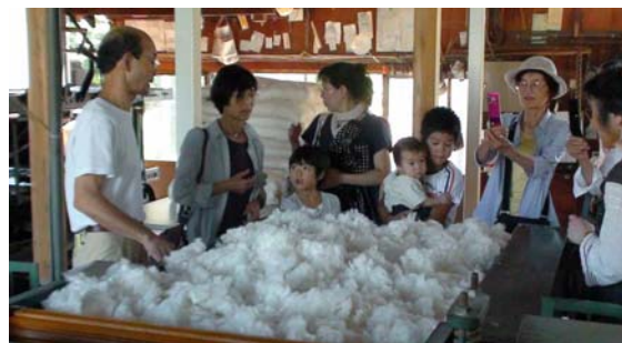
8/30 綿繰り娘と理事たちで川亀ふとん店訪問