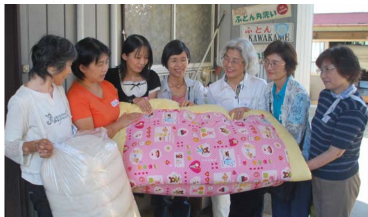
あいコープふくしまのお母さんたちと共に、常総市の川亀ふとん店にて