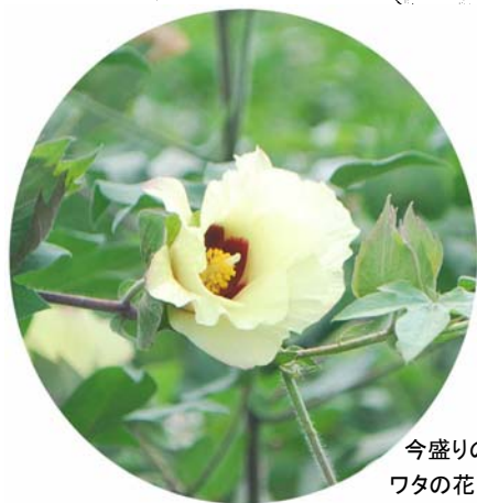
今盛りの ワタの花