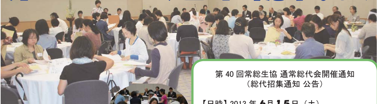
昨年の総代会風景