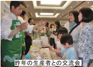
昨年の生産者との交流会

○午後からは生産者との交流会が予定されています。 総代さんでなくても、ぜひごいっしょに参加下さい。