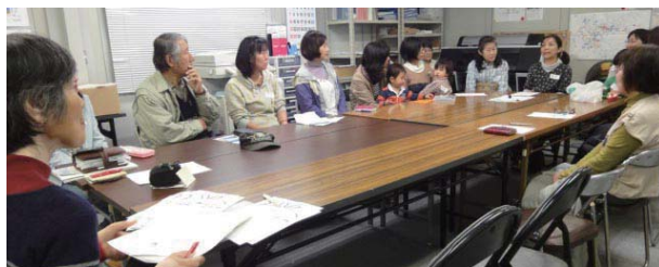
4/24には本部にて総代1年の振り返り懇談会を開催しました。

○ 何をするのが総代か 分からないまま一年間を終え、申し訳ない気持ちです。にもかかわらず、2013年の総代も続けてお引受けしてしまい、今年こそは、少