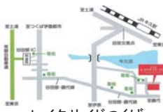
レイクサイドつくば