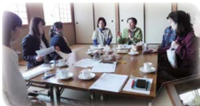
「子ども被災者支援法」の署名を届けに来たの！ (4/22 つくば地区懇談会)

「7月で丸5年。サンプルの岩瀬さん豚肉、おかべや豆腐があまりに美味しくて加入。生協祭などでお手伝いをしてから、すごい生産者がいる生協に感動して続いている感じ。常総生協のレシピ集作ろうよ。」