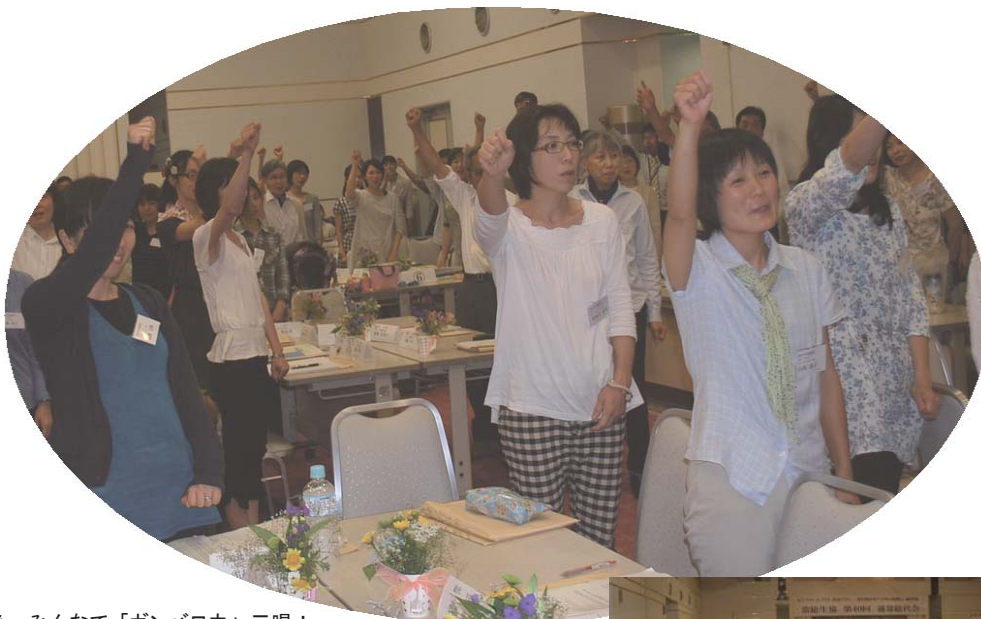
総会終了後、みんなで「ガンバロウ」三唱！

はじめよう！暮らし見直し 総点検 みんなの協同で暮らしを建て直す生協へ。 心の動力で社会変革。