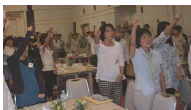
総会の「しめ」に、今年度も元気に頑張る景気付けに恒例の「ガンバロウ三唱」！