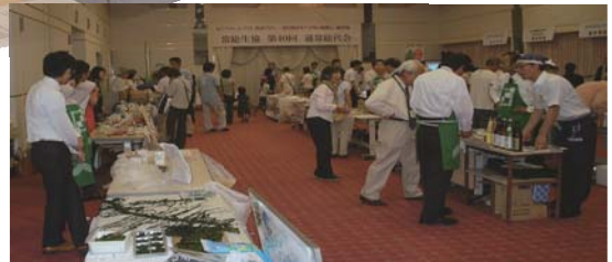
午後からの生産者交流会の様子。とてもにぎやかでした。

はじめよう！暮らし見直し 総点検 みんなの協同で暮らしを建て直す生協へ。 心の動力で社会変革。