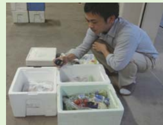
箱内の温度を測るデジタル温度計(上)と調査中の商品部職員。