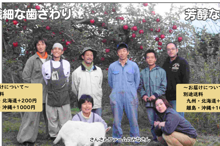
さんさんファームのみなさん