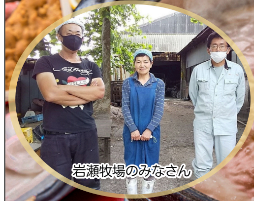
岩瀬牧場のみなさん