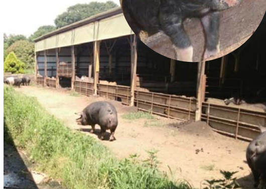
豚舎の前の広場をゆっくり散歩する妊娠中の母豚