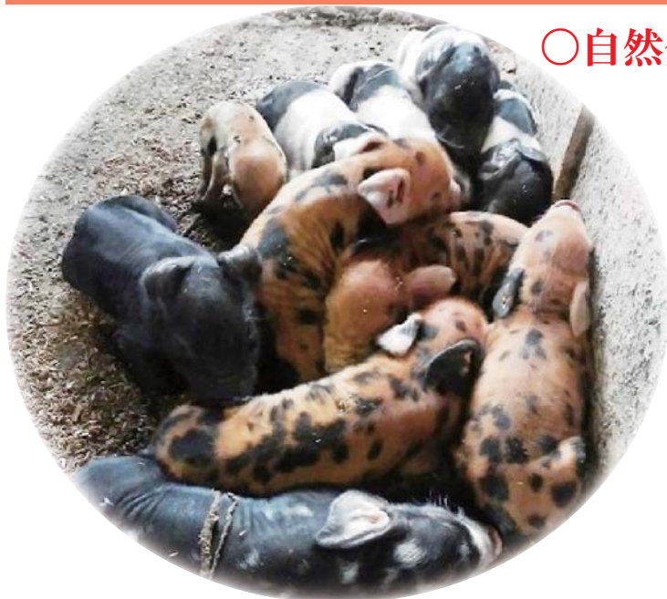
寒いと身を寄せ合って暖めあう子豚たち（分娩室）