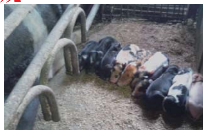
母豚の横に一直線に整列しておっぱいを待つ