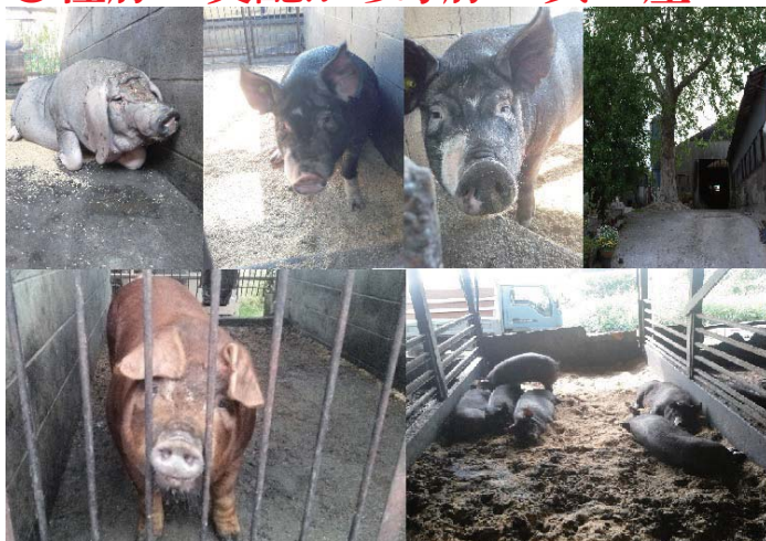
生協から贈られた種豚の原種（3種♂♀計10頭）