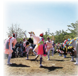
事故前の村のお祭り

ようやく茶屋も軌道に乗り始めたそんな矢先、原発事故が起こり、全村避難という事態になりました。