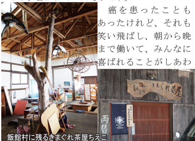
飯館村に残るきまぐれ茶屋ちえこ

また農家としての自立もせねばと、還暦を迎え、「農家レストラン気まぐれ茶屋ちえこ」を立ち上げて、村に来る方たちへ自宅の畑や山で採れる旬のおいしい田舎料理でおもてなしし、喜ばれていたそうです。