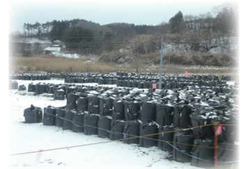
2015.1.17 飯館村 汚染土が……