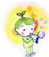
イラスト やまがみあやの

私は、合成洗剤の体や環境への負荷のあまりの大きさにショックを受けて合成洗剤を使えなくなり、以来5年程経ちますが不自由は感じていませんし、むしろ快適です。石けんをフル活用！して暮らしを楽しむにはまだまだですが、まず一步を踏み出さないと始まらない。ので、まず一步！のための情報として、「石けんと合成洗剤の違い」をシリーズでお伝えしていきます。 太陽油脂さんの工場見学の際の資料と、お勧め頂いた本からの抜粋です。