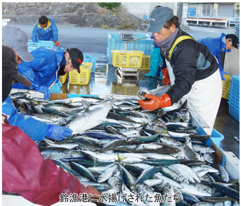
鈴漁港に水揚げされた魚たち