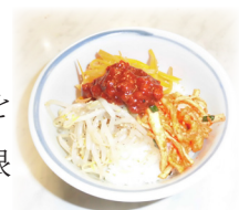
ピビムパップ (ピビンバ丼)

また、乳酸菌を使った発酵食品で体に良い一品、是非ご家族に食べていただきたいとの想いで、今年度は乾物講習会『キムチ編』として、全4回シリーズで開催することになりました。