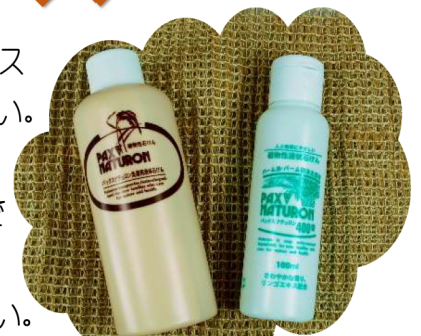
台所用:カタログNo.814 洗濯用:カタログNo.782 の試供品です