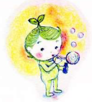
イラスト やまがみあやの

次は「5. 排水が川に流れると…」 「6. 販売量」です。(担当 といだ@常総市)