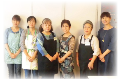
乾物一座の皆さん

次回の乾物講習会「キムチ編」第2回は、7月29日(土)です。場所は、我孫子市けやきプラザ 8F 料理実習室。1回目の参加者優先になりますので、若干の募集となります。