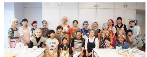
第1回キムチ講習会 参加者全体写真