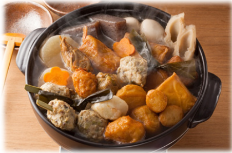
商品名：おでん種セット