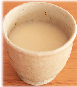
商品名：造り酒屋の甘酒のもと (商品説明)

国産の無リンすり身を使用し、魚の旨味を追究したおでん種セットです。だしがスープに溶け込み、絶妙な味わいを引き出します。