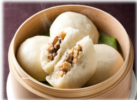
商品名：天津包子（肉まん）

原料は米と米麴のみ。酒造好適米「ひだほまれ」を100%使用した濃厚な甘みが特長。冷やしても、温めても。