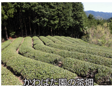
かわばた園の茶畑

一般的には、お茶の畑という広い場所に新緑の茶畑が広がっているイメージがありますが、かわばた園の茶畑はそのイメージとは全く異なります。転げ落ちそうになるくらいの急斜面をトラックで登り切った山頂付近の木々に囲まれた場所にその茶畑は点在しています。