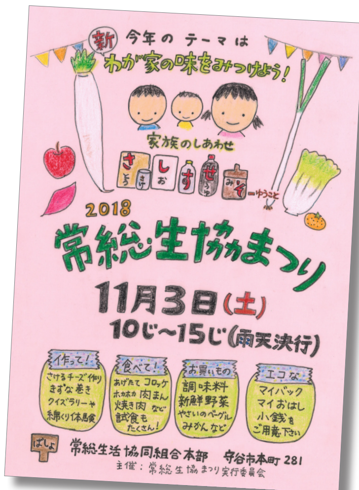
今年のチラシは手書きで味のあるチラシに仕上がりました!!

今年は開催時間も 1 時間長くなりました。ぜひご都合をつけてご来場ください!(^^)!