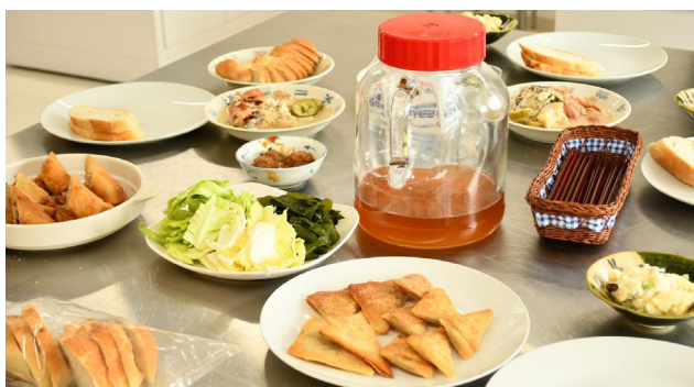
地粉春巻きの皮のスイーツは好評でした！