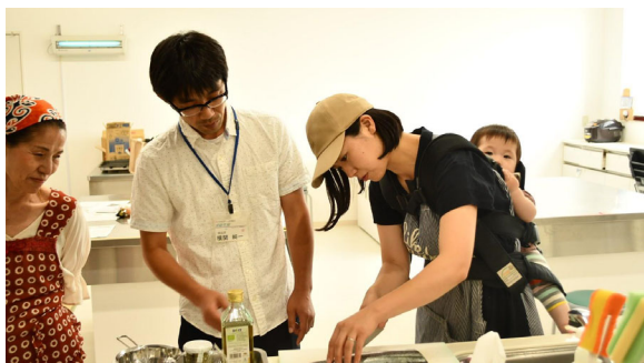
鮮魚セットを実際にさばきました。参加された組合員さんも上手にさばくことができました。