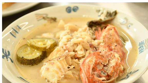
鮮魚セットのアクアパッツァと旬の野菜